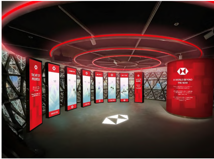
圖片一：滙豐與 K11 MUSEA 攜手呈獻香港最具代表性及最大型 NFT 展覽之一，而滙豐亦將展出兩件 NFT 藝術品。