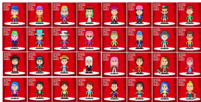
圖片三：為隆重其事，滙豐將送出 1,000 個環保非交易 NFT 予滙豐客戶，為香港首間送出 NFT 收藏品的零售銀行。