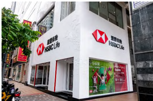
滙豐保險策劃中心