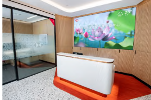
中心主題採用「Life in Bloom 讓生活一直綻放」